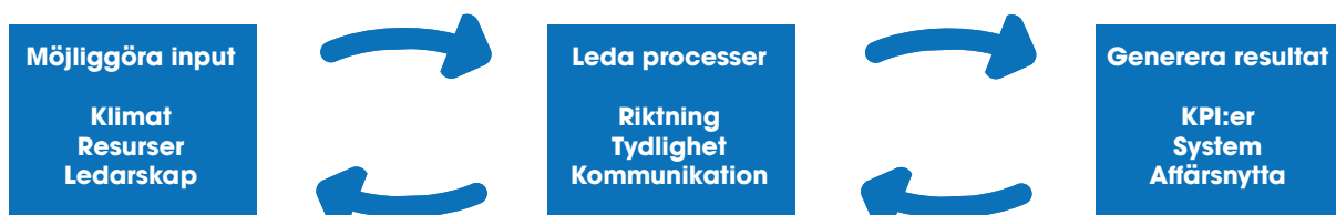
Figur 1, ett systematiskt förhållningssätt till innovation